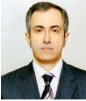
Bahadır ÇENBERCİ Meclis Başkanı