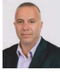
Can GÜLMEZGİL Mes. Kom. Üyesi